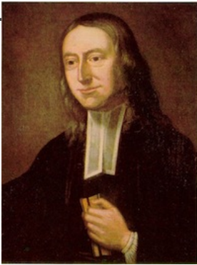
5.3 John Wesley

John Wesleys religiösa utveckling tvåhundra år senare påminner om Martin Luthers och är indirekt beroende av honom.