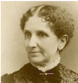
Mary Baker Eddy