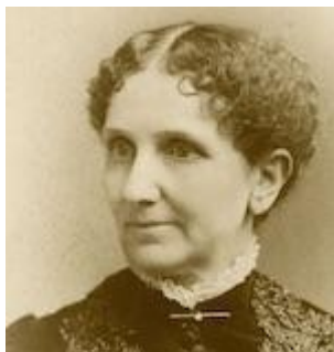
Mary Baker Eddy