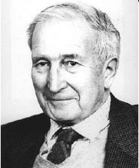
Anthony Flew - den störste ateisten av dem alla

Som du skall förstå lite längre fram i texten finns det väldigt många framstående vetenskapsmän som har en tro på en Gud i någon form. Många av dessa har tidigare varit evolutionstroende, men har genom sina upptäckter inom forskningen tvingats lämna en sådan tro till förmån för en tro på en Skapare. Jag skall lyfta fram några intressanta exempel som jag hämtat ur en bok som just handlar om prisbelönta forskare som börjat tvivla på Darwin. När man läser deras uttalanden förstår man att det inte längre är ett hållbart alternativ att tro på en storskalig evolution.