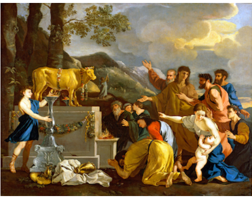
Salomos son Rehabeam blev efter

uppdelningen kung för Juda rike , och Salomos tjänare Jerobeam blev efter ett uppror kung över den del som fortsatt kallades för Israel . Med tiden blev Jerobeam orolig över att hans folk skulle dra upp till Jerusalem i Juda rike för att dyrka Herren Gud där. Jerobeam gjorde därför två guldkalvar som hans folk skulle dyrka på plats istället för att åka upp till Jerusalem. Och observera nu detta: dessa två guldkalvar representerade Herren Gud, men de väckte ändå Guds vrede: